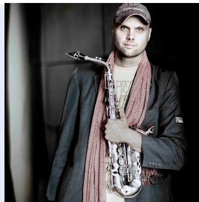
Ties Mellema

Als luisteraar beleef je het proces van verandering. Je komt dan ook ogen en oren te kort!